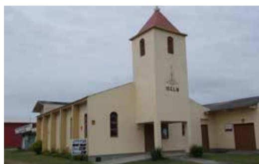
Mariluz - Rua Viamão, 773 esquina Av. Paraguassú