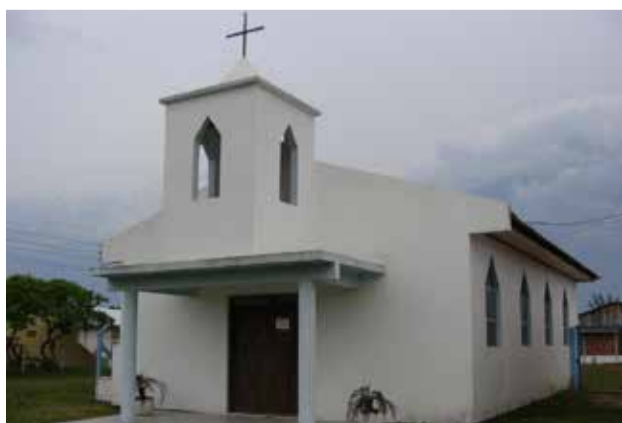
Rondinha Capela Ecumênica ao lado da Sociedade Esportiva