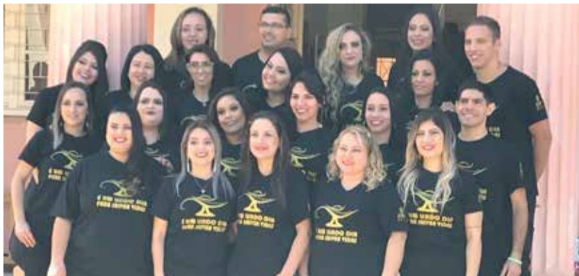
Ao lado, Turma Técnico em Enfermagem ESEP noturno; abaixo (esquerda), Formandas e formandos dos curso de graduação da Faculdades EST e abaixo (direita), Turma Técnico em Enfermagem ESEP diurno