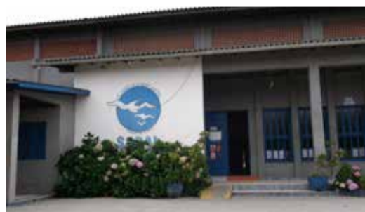
Albatroz SABAL - Soc. Amigos Albatroz