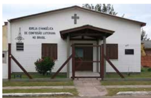
Pinhal - Rua 25 de Março, 589 (Rua do Restaurante Gabriela)