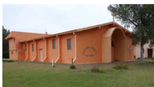
Tramandaí Sul - Igreja Católica Rua Brasília, 496