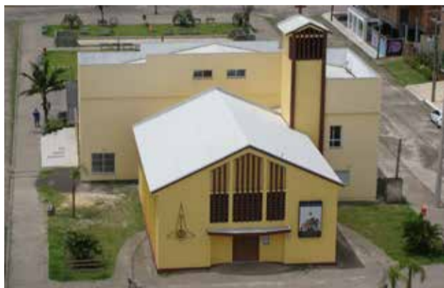
Capão da Canoa (Sede paroquial) Rua Tiaraju, 278 - B. Navegante