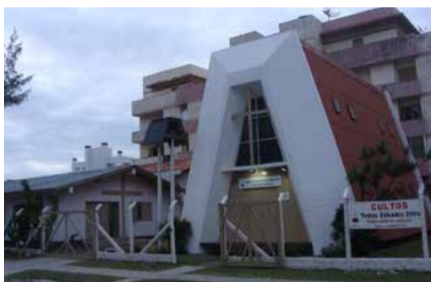
Torres Av. Benjamn Constant, 830