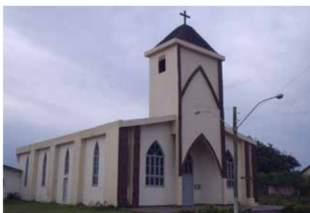
Curumim Templo católico - Av. Paraguassu