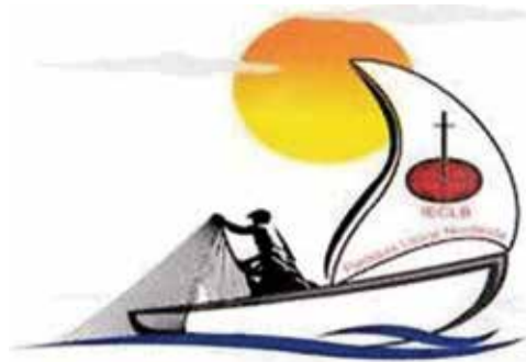
Igreja Evangélica de Confissão Luterana no Brasil