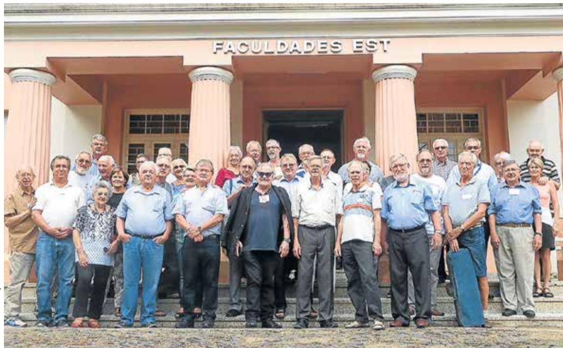
Assessoria Imprensa Faculdades EST

Na sequência, os/as participantes do evento dirigiram-se ao pátio da Faculdades EST com o intuito de deixar uma marca simbólica de sua visita. Eles plantaram, em conjunto, um ipê roxo, que deverá florescer em meio à área verde da instituição. Já à noite, não faltou animação no jantar e no baile dos ex-alunos, que ocorreu no Prédio S.