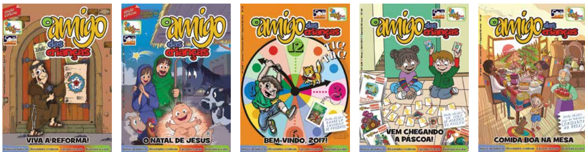
No seu atual formato, a revista circula desde 2006, em edições bimensais de 20 páginas. Estas são as capas das 5 últimas edições, de setembro/2016 a junho/2017