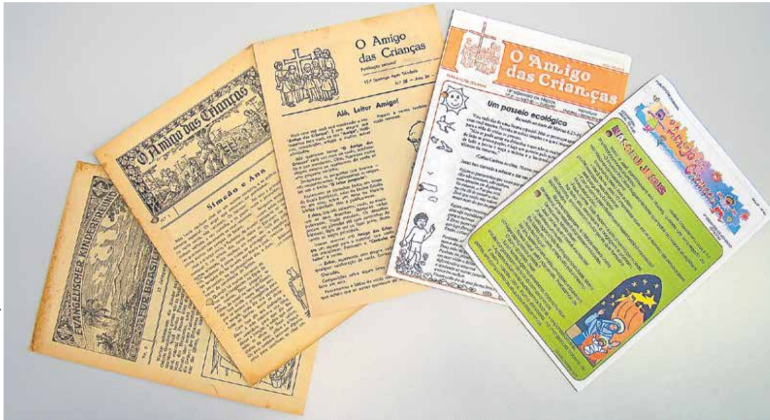
Coordenadoria de Educação Cristã da IECLB