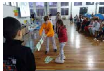
Dinâmicas ajudaram a decorar os versículos da história