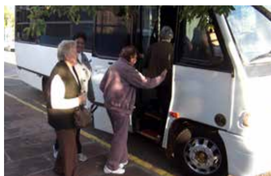
O motorista é sempre muito carinhoso e atencioso com as vovós, auxiliando-as no embarque e desembarque.

Em razão da dificuldade de locomoção, que atinge vários idosos, o nível de participação na Tarde de Integração e no Raio de Sol estava diminuindo. Buscando resolver esse problema, foi iniciado, ainda em 2014, o transporte até a comunidade por minivan, em que cada idoso/a embarca e desembarca na frente de casa.