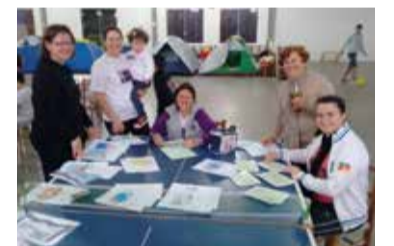
A equipe de professoras organizando os trabalhos

No sábado à noite, todos participaram do culto cantando e também usavam a camiseta que ganharam com a foto da turma do 4º Acampadentro estampada na frente. Todas as despesas com camisetas, alimentação, trabalhos manuais e locação de cama elástica foi feita com doações dos pais e membros da comunidade, sem onerar o caixa da comunidade.