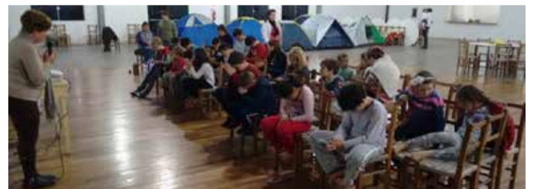
Momento de oração e aprendizado com a história bíblica

Temos a Equipe da Escolinha Dominical ajudando e organizando o Acampadentro. Também temos a equipe da cozinha. Este ano, tivemos a participação de 28 crianças. A História Bíblica usada foi a "Vida do Profeta Jonas", e as crianças aprenderam sobre a OBEDIÊNCIA a DEUS.