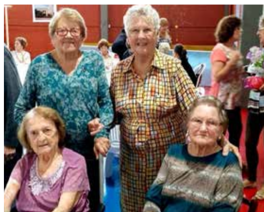
O grupo das "mais experientes", participando ativamente dos trabalhos

Em todas as reuniões é compartilhada uma palavra bíblica. O Raio de Sol, representado por sua liderança, demonstra através da prática de visitas, telefonemas e através da oração que cada participante é muito importante para a comunhão do grupo, resgatando, assim, os participantes afastados por algum motivo. Além de todo esse trabalho em grupo, o Raio de Sol tem como prioridade estimular todos os participantes à prática individual da espiritualidade através da oração e leitura da Bíblia.