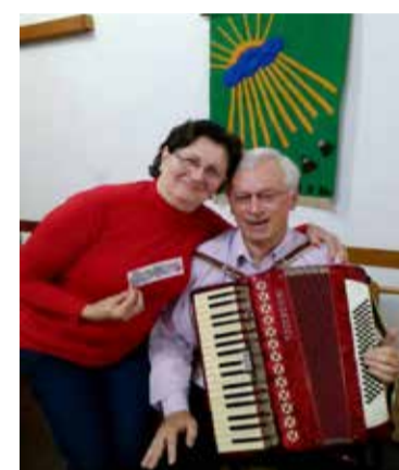
O animado gaiteiro do Raio de Sol