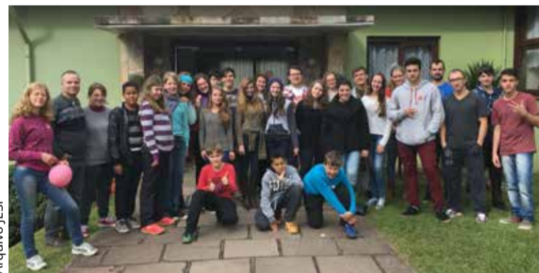
Jovens da JESP aprofundaram o tema "Redescobrimos os dez mandamentos e o mandamento do amor para a vida e comunidade"

O caminho do amor sempre será novo e vivo, pois nunca envelhece, fica ultrapassado ou morre. A melhor forma de andar não é com o melhor veículo ou ainda girando o mundo pelas redes sociais com muitas postagens e comentários... a melhor forma de andar ainda é com o amor e em comunidade, vivenciando o estudo e a espiritualidade, a sua linguagem e forma.