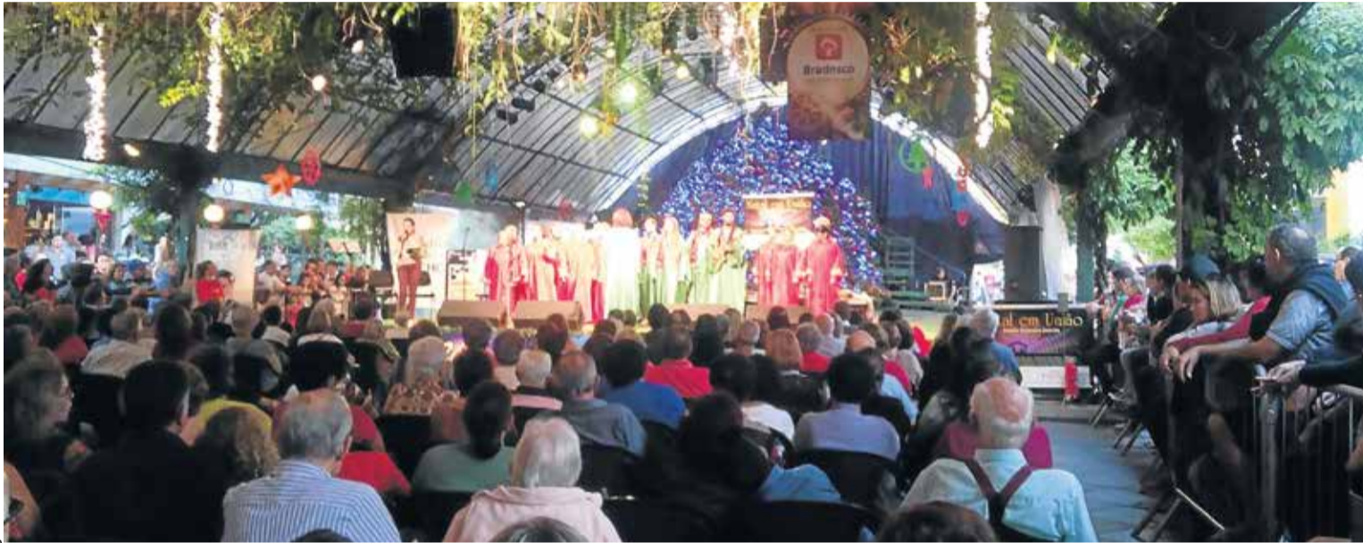
Journalismo União FM - NH

Numa proposta do Conselho Intersinodal de Programação Evangélico-Luterana da Rádio União FM, os Sínodos Nordeste Gaúcho e Rio dos Sinos se mobilizaram junto com a emissora e fizeram o "Natal em União", em igrejas, praças, ruas e em lugares já conhecidos por sua tradição natalina, como a Rua Coberta em Gramado (p.5).