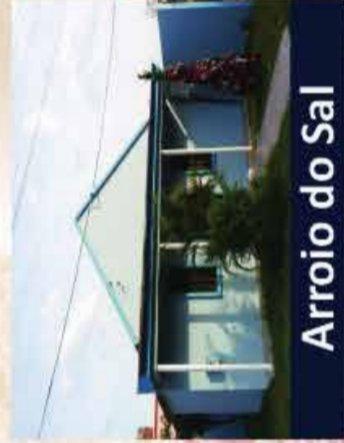
Arroio do Sal

08/12 - 20:00 Culto de Advento com Confraternização 08/03 - 19:00 Culto em Ação de Graças.