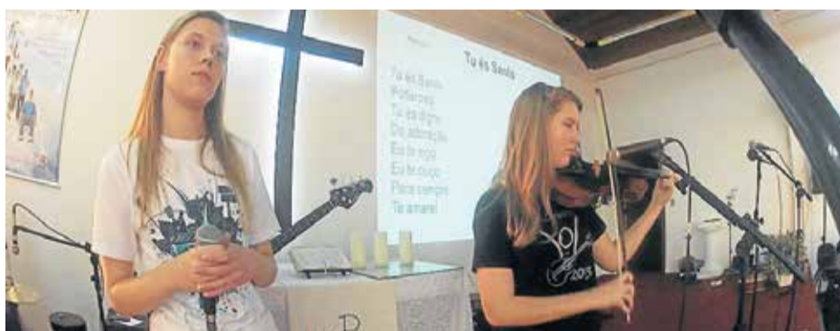
Banda da Ascensão (NH)