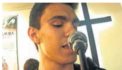
70 x 7