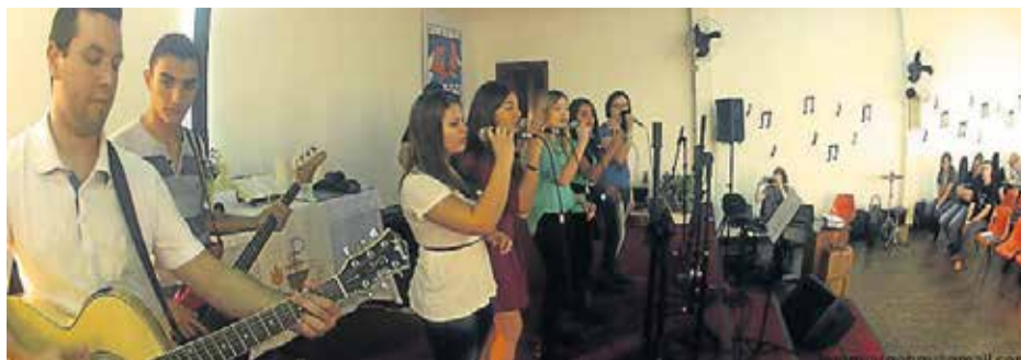
Banda de Canoas