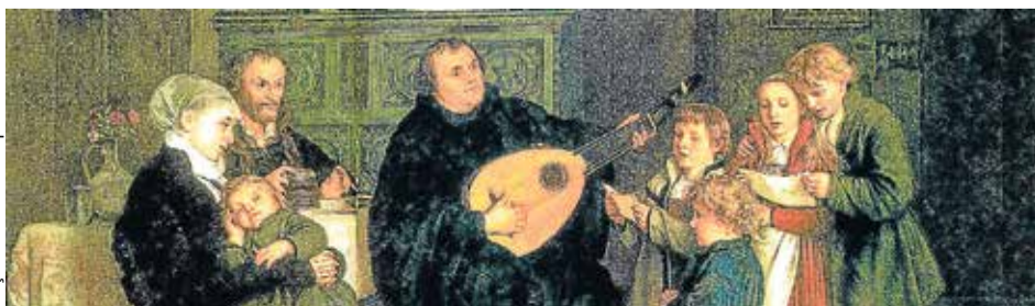
Lutero faz música no seu círculo familiar Autor: Gustav Spangenberg (cerca de 1875)

Fonte: Martinho Lutero Obras Seleccionadas - Volume 7 Editora Sinodal - Editora Concórdia