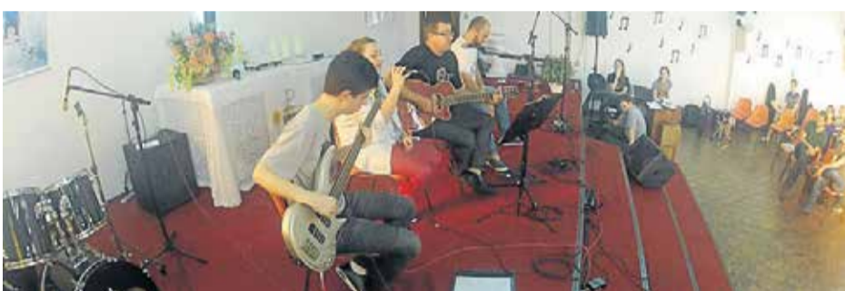
Banda da Comunidade Espírito Santo (NH)