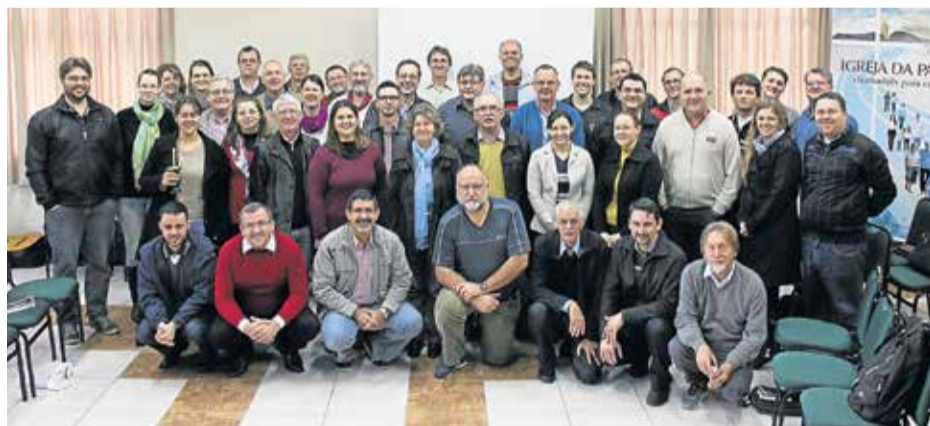
O curso de formação continuada se estendeu por dois dias