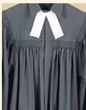
Ministério pastoral (modelo tradicional e alba com estola)