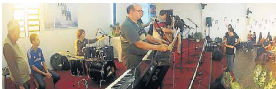
Banda de Quinta