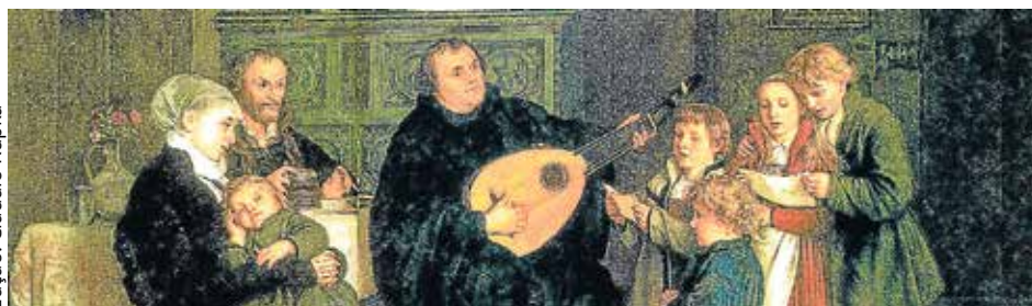
Lutero faz música no seu círculo familiar Autor: Gustav Spangenberg (cerca de 1875)

Fonte: Martinho Lutero Obras Seleccionadas - Volume 7 Editora Sinodal - Editora Concórdia