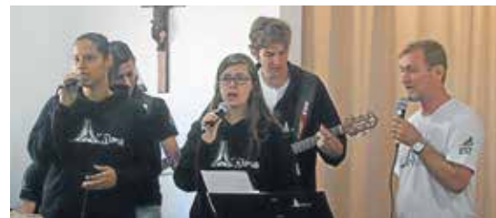
O grupo Ânima da Faculdades EST nos tocou com sua mensagem cantada

Seguiu-se o almoço colonial, preparado por uma equipe bem entrosada e alegre, satisfazendo os quase 300 participantes que vieram comemorar conosco.