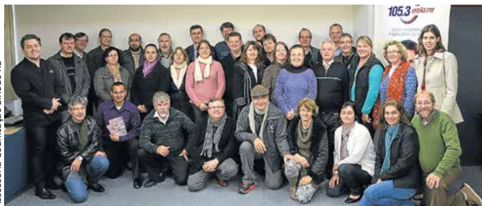
"Comunidades em União" reuniu colaboradores de três sínodos em 28.05.2014

Toda a programação evangélico-luterana da União FM tem a forte marca do voluntariado. Mais de uma centena de homens e mulheres escrevem os textos que dão conteúdo a esses programas já citados. No caso do Comunidades em União, veiculado nos domingos de manhã, os ministros e ministras não apenas redigem seus textos mas fazem, eles mesmos, a locução nos estúdios das rádios de Novo Hamburgo e Pelotas. Os textos do Conversando com Você são escritos exclusivamente por mulheres. Por iniciativa do Conselho Inter-Sinodal e patrocínio da União FM, os colaboradores desses dois programas tiveram seu seminário de preparação no ano de 2014.