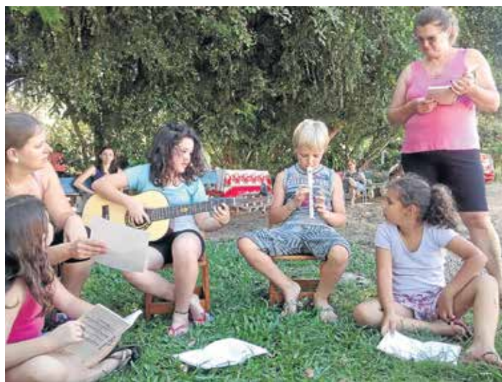
Ênfase à música e ao convívio nas atividades com as crianças da Paróquia

nhecer! Não somos muitos, mas nos sentimos parte de uma grande família. O nosso coração ficará alegre com a sua visita!