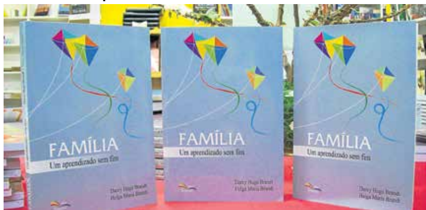
Arte: Editora Sinodal

Para algumas pessoas, é clara a necessidade da família para o desenvolvimento do ser humano, ainda que a sua estrutura tenha se modificado ao longo dos anos. Adaptar-se às transformações é uma atividade a ser feita em conjunto, mesmo que a cada ano seja mais difícil reunir todos em volta da mesa, até mesmo para as refeições.