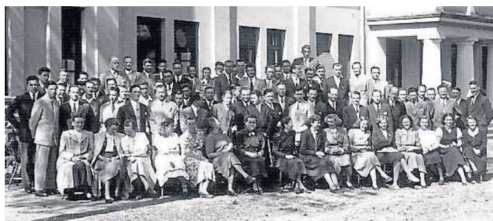
O primeiro "Dia do Ex-aluno do IPT" foi celebrado em 1949

O projeto é do arquiteto Theo Wiederspahn. A escola visava preparar alunos para o estudo de Teologia e outros cursos superiores. Praticamente todos os ex-alunos, mesmo não tendo uma relação profissional com a igreja, passaram a ser formadores de opinião, influenciando grandemente no desenvolvimento de nossa igreja e do nosso país.