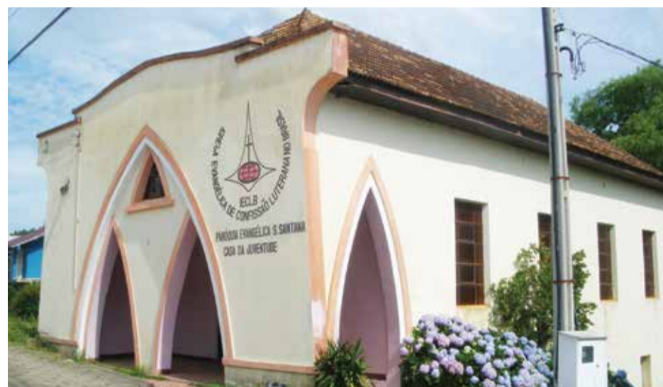
A Casa da Juventude