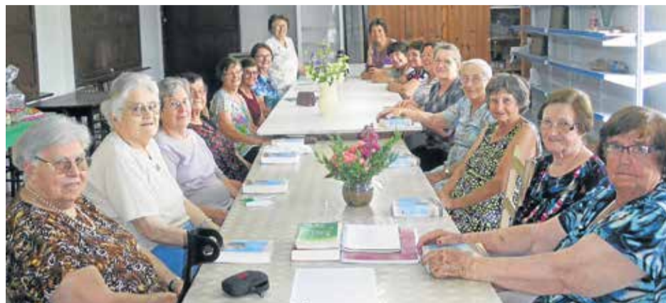
Encerramento do grupo da OASE

Esta é a área geográfica do Sínodo Rio dos Sinos. A cada edição do Sinos da Comunhão, uma comunidade ou paróquia será destaque.