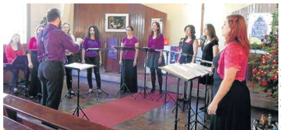
Arquivo Delmar Dieckel

O Donna Você apresentou-se no dia 7 de dezembro, às 10h30, na Igreja Bom Pastor em Esteio.