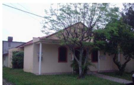
Arroio do Sal

Capela ecumênica ao lado da Sociedade Esportiva