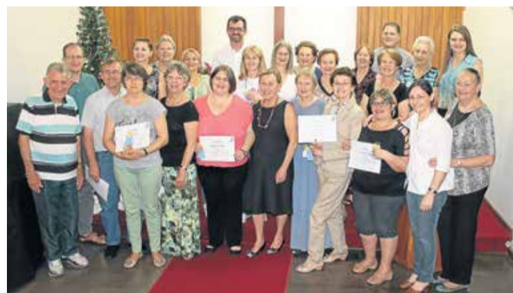
Arquivo Pastoral do Cuidado

Na celebração estiveram presentes os participantes e o assessor do curso, bem como outros ministros, o pastor sinodal e demais convidados. Após a celebração, foi servido um gostoso coquetel preparado, com todo o carinho, por integrantes do grupo.