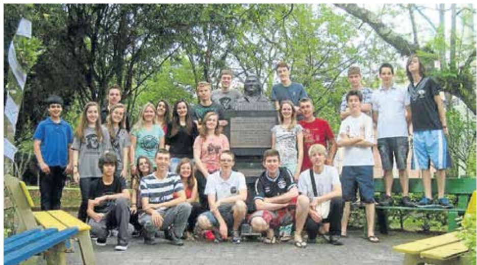
Retiro do grupo de Jovens