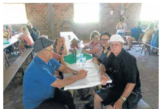
A Comunidade de Confissão Luterana em Maquiné participou do encontro organizando um saboroso almoço.