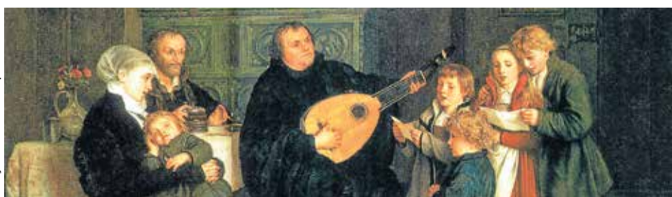
Lutero faz música no seu círculo familiar Autor: Gustav Spangenberg (cerca de 1875)