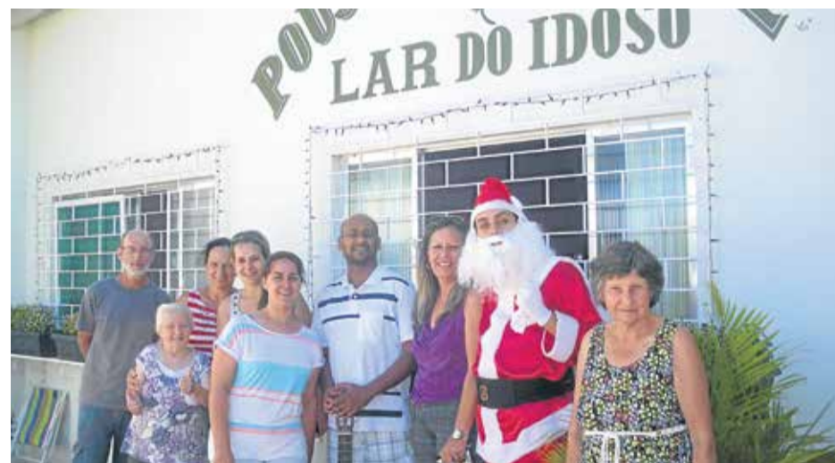
Grupo de visitantes da Comunidade Cristo Salvador