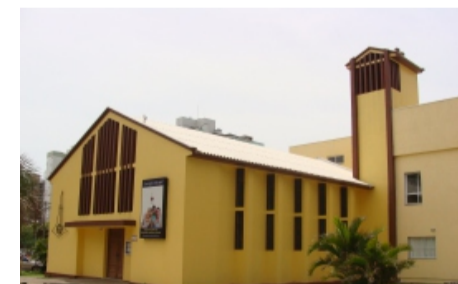
Capão da Canoa