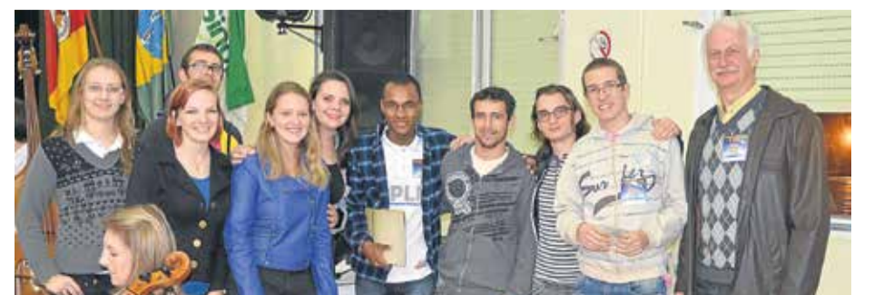
O Projeto Pedagógico Litúrgico Musical da Faculdades EST recebeu seu reconhecimento do presidente do Conselho Sinodal