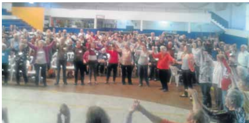
Cerca de 200 pessoas participaram do 8º Dia Sinodal da Terceira Idade