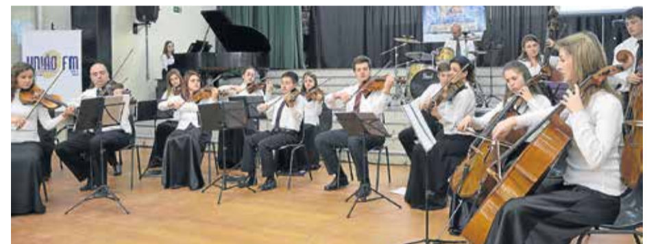
Na parte da noite, precedendo o anúncio das composições classificadas, houve uma bela apresentação da Camerata Ivoti.