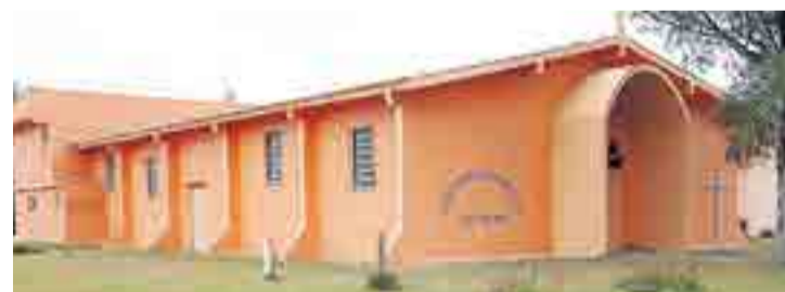
Balneário Tramandaí Sul