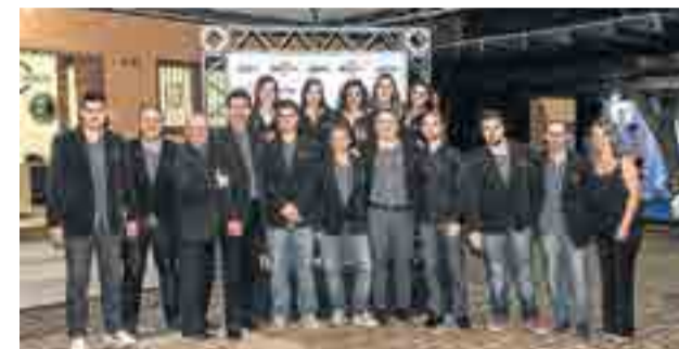
Gerência e equipe de colaboradores da União FM, reconhecidos por seu trabalho