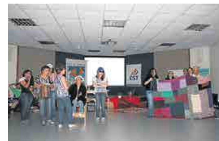
Seminário de Criatividade