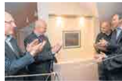
Descerramento da placa comemorativa e o corte da fita inaugural com presença de autoridades e representante da família Sarlet