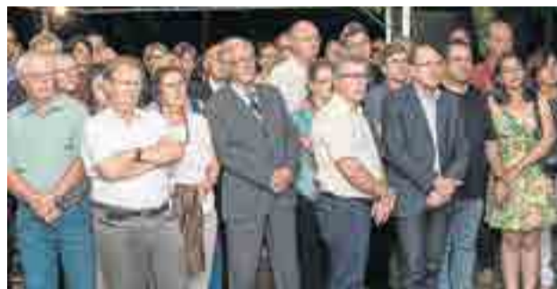
Público assiste a video institucional que mostra a força da presença da União FM no Vale