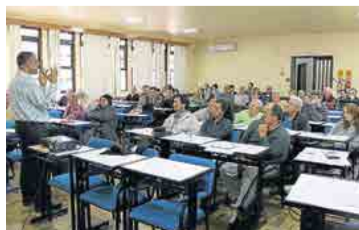
Curso de Missão Urbana