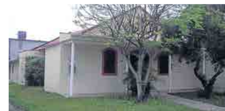
Arroio do Sal