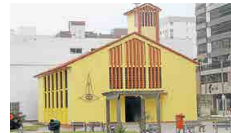
Capão da Canoa

Culto com Santa Ceia - 11/03, terça-feira, às 19h