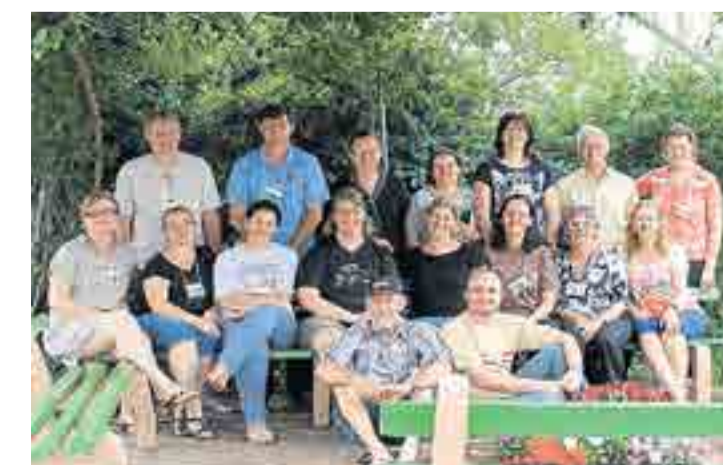
Retiro Sinodal de formação de líderes