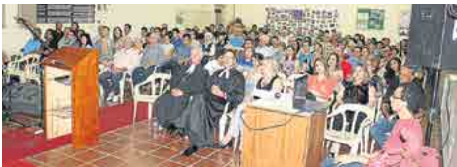
A comunidade celebrou com muita alegria e louvor seus 40 anos.

Durante o ano de 2013, uma comissão de membros se reuniu e preparou um evento especial para a comemoração dos 40 anos. O evento ocorreu nos dias 29 e 30 de novembro e 1º de dezembro, data próxima ao aniversário de lançamento da pedra fundamental da igreja, que teve sua construção iniciada em 19 de novembro de 1973.