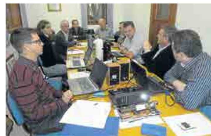
Conseho Inter-Sinodal de Programação - União FM