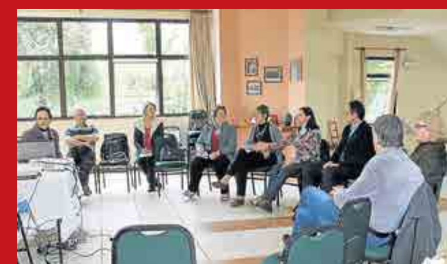
O Conselho de Planejamento Estratégico reúne lideranças envolvidas no trabalho comunitário e nos oito conselhos assessores

Entendemos que planejar não é apenas importante, mas necessário. Motivamos as comunidades, paróquias e instituições para que sigam o exemplo e pensem no presente e futuro de sua existência e, se ainda não o fizeram, organizem um grupo de planejamento estratégico. A missão da igreja agradece.