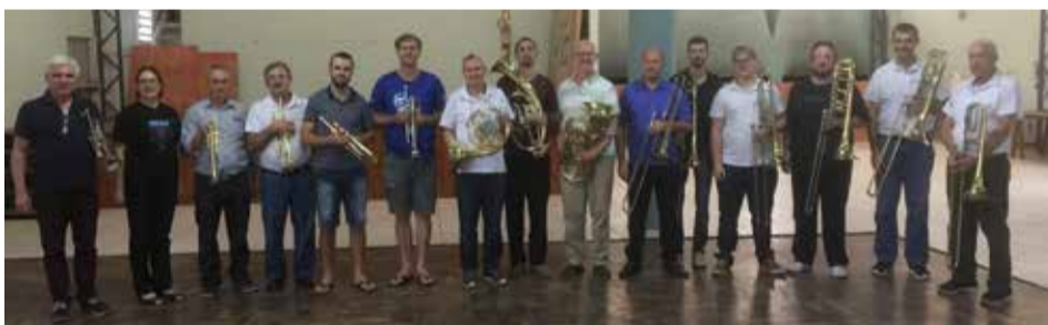
Encontro Regional Sul de Trombones em Capela de Santana (maio/2018)