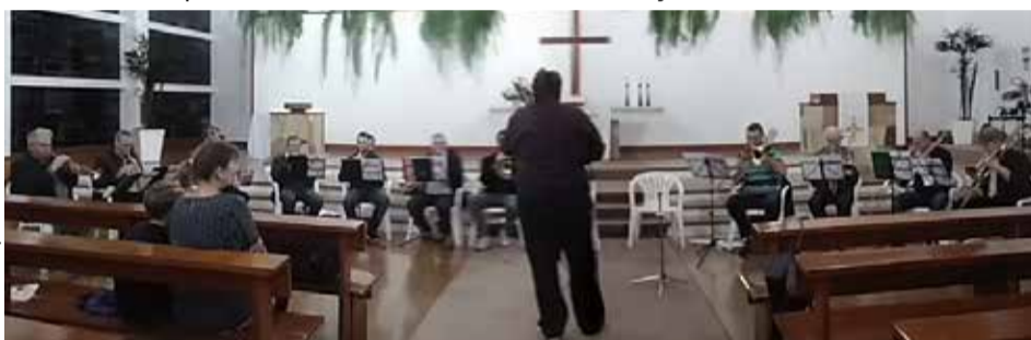
Encontro Regional de Trombonistas em Ivoti (maio/2017)