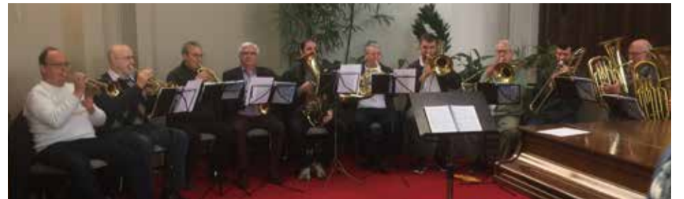
Trombonistas participaram da Assembleia Sinodal do Sínodo Rio dos Sinos

Na OMMA entendemos que através da música sacra também se faz missão e se propaga o evangelho de Jesus Cristo, despertando e afirmando a fé. A música acorda as nossas emoções, faz bem para os ouvidos e para a alma, alcança dimensões do ser humano que as palavras não atingem, nos anima a enfrentar outros desafios que a nossa fé no Cristo ressuscitado nos coloca. A OMMA é uma obra em nível nacional, sendo que cada sínodo tem autonomia para organizar o seu funcionamento e o seu financiamento. Como entidade nacional, a OMMA organiza pelo menos um encontro nacional de trombonistas, que neste ano será no final de agosto em Pomerode, SC.