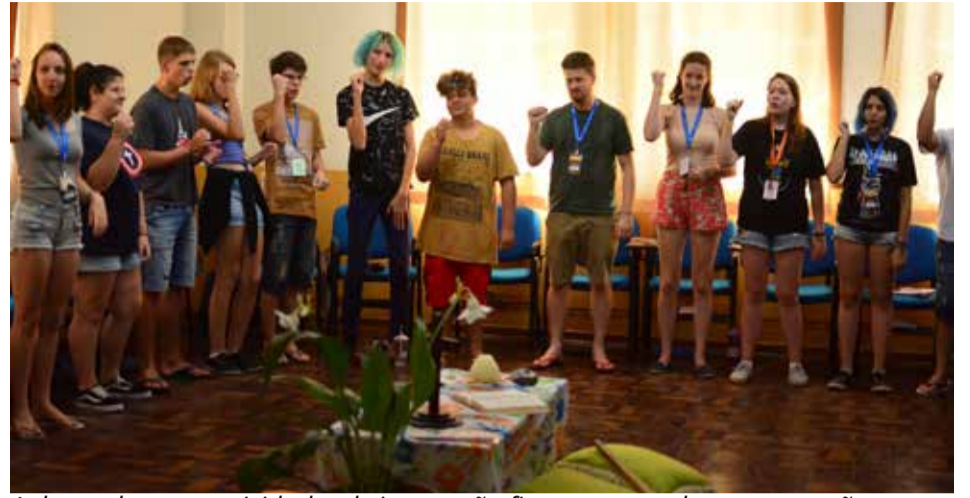
Aulas, palestras e atividades de integração fizeram parte da programação

Os jovens também tiveram a oportunidade de conhecer a Editora Sinodal, a sede do Sínodo, a Faculdades EST e a Casa Matriz de Diaconisas, onde tomaram café da tarde com os idosos e promoveram uma atividade lúdica (foto abaixo).