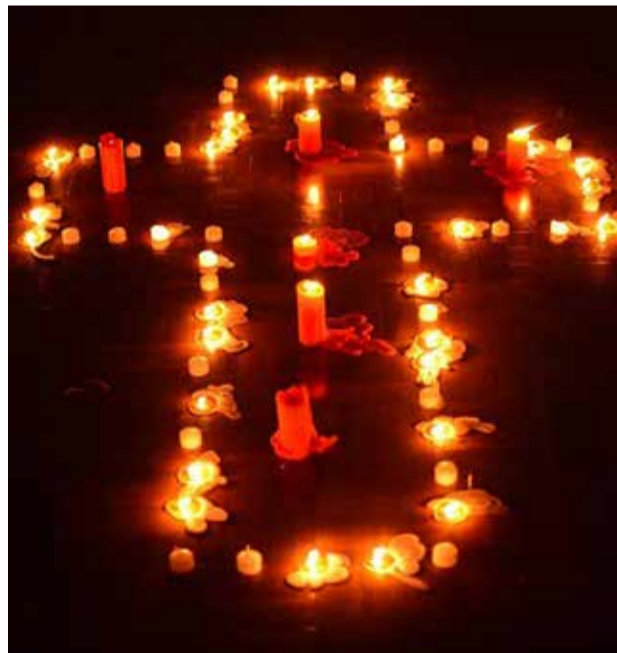
Nas celebrações da noite os jovens desenvolveram temáticas das aulas e palestras, como o Culto de Tomé, o Culto de Taizé, o Culto do Caminho e o Culto Ágape.