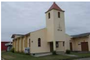
Mariluz - Rua Viamão, 773 esquina Av. Paraguassú