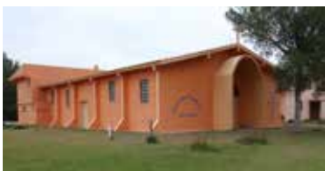
Tramandaí Sul - Igreja Católica Rua Brasília, 496