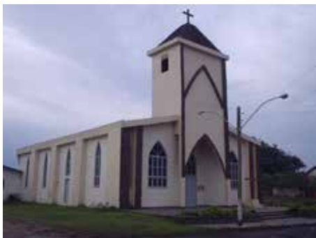
CURUMIM Templo católico - Av. Paraguassu