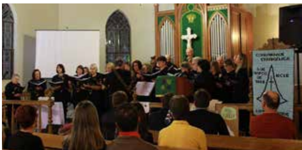
Apresentação do Coral Municipal de Igrejinha

Oficialmente a Comunidade Evangélica de Lomba Grande foi fundada em 5 de março de 1848. Mesmo com essa 'data oficial', há registros de que em 1834, portanto 14 anos antes, evangélico-luteranos já se organizavam na formação de sua escola, comunidade e igreja. O cemitério local também tem registros oficiais de sepultamento que datam de 1839. Tudo isso deu ensejo a que, durante o ano de 2018, a Comunidade realizasse diversos eventos celebrativos, com a presença de ex-pastores, corais e grupos de louvor.