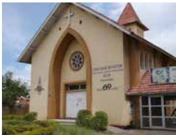
Tramandaí - Sede da Paróquia