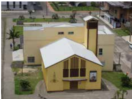
CAPÃO DA CANOA (sede paroquial) Rua Tiaraju, 278 - B. Navegante