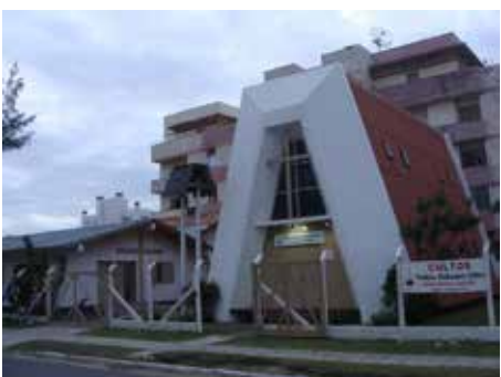
TORRES Av. Benjamn Constant, 830