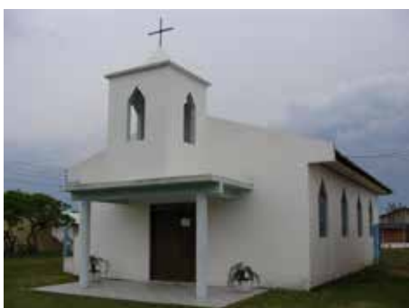
RONDINHA Capela Ecumênica ao lado da Sociedade Esportiva