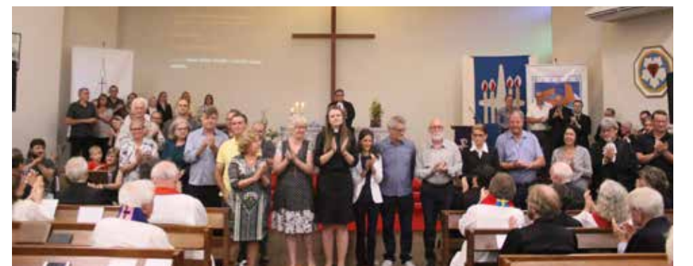
O novo Conselho Sinodal indicado para a gestão 2019-2022

Em ato oficial de investidura foram entregues aos dois pastores as respectivas cruzes que identificam o cargo: "Ela é sinal de renúncia, de serviço e de entrega ao nosso Senhor Jesus Cristo, a quem devemos seguir". Nesse compromisso ambos aceitaram seus cargos mediante um "Sim. Com o auxílio de Deus". Ambos também receberam o Certificado de Diplomação. Membros indicados por suas comunidades para comporem o Conselho Sinodal durante os próximos quatro anos, foram apresentados e assumiram seus cargos frente ao Sínodo Rio dos Sinos.