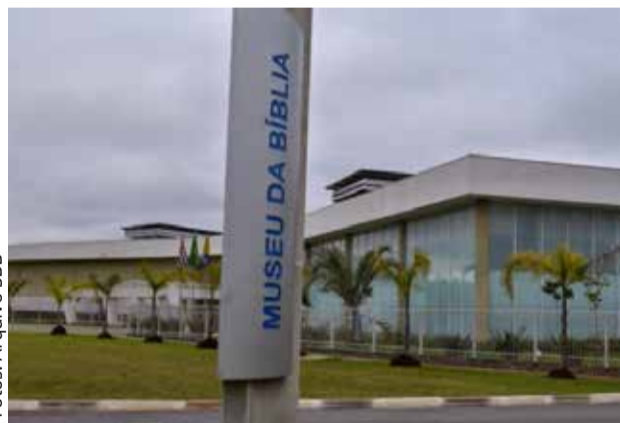
Prédio do Museu da Bíblia em Barueri/SP

Ele não exibe obras que tornaram famoso algum artista. É um Museu da Bíblia (MuBi). Ele existe. Você pode ir até lá. Muitas pessoas conhecem a Bíblia, estudam a Bíblia e gostam dela. Ir ao MuBi significa aproximar-se desse livro que acompanha a sociedade humana por séculos. E, para o Museu da Bíblia, receber visitantes significa reencontrar pessoas a quem a Bíblia (sua mensagem) se destina.