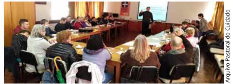
Arquivo Pastoral do Cuidado

Em nossos cursos lembramos às pessoas o motivo que as inspira para visitar e ensinamos as ferramentas básicas para a prática da visita. O que fazer e dizer? Orientamos para posturas importantes dentro do ambiente hospitalar, que é muito diferente do ambiente doméstico.