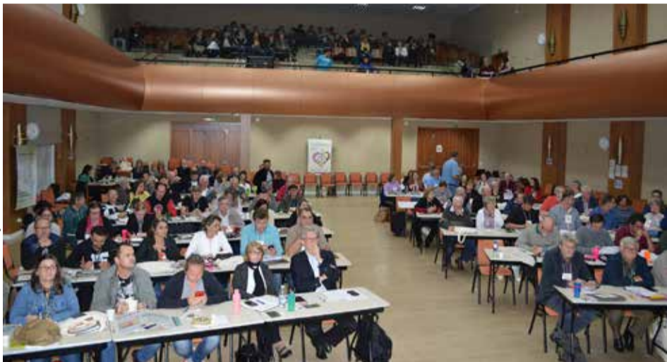
Assessoria Comunicação IECLB

Entre representantes, lideranças, Delegados, Delegadas, convidados ecumênicos, convidadas ecumênicas e equipe de apoio, participaram do Concílio em torno de 200 pessoas.