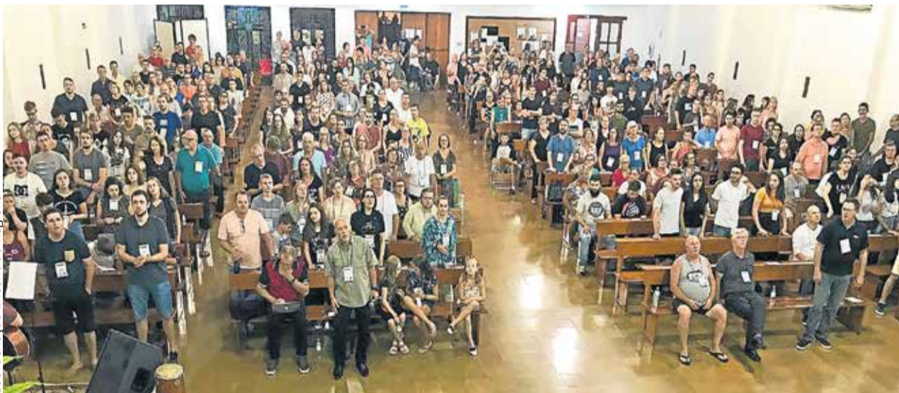
Coordenação Encontrão Regional

No primeiro final de semana de março aconteceu o tradicional Encontrão Regional, promovido pelo Movimento Encontrão, área da Grande Porto Alegre. Cerca de seiscentas pessoas participaram do evento (p.5)