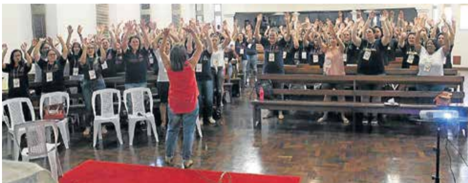
Seminário reuniu professoras das escolas de educação infantil da ABEFI

Sendo legalmente constituída, iniciou com a Escola de Educação Infantil da Paz. Atualmente, a ABEFI tem 12 unidades, sendo elas escolas de educação infantil, casas de acolhimento, abrigos e um colégio. Esses locais estão nas cidades de Novo Hamburgo, Esteio, Taquara e agora, também, em São Sebastião do Caí (veja foto da capa), com uma Casa Lar inaugurada 1º de fevereiro. O espaço foi criado para acolher até 10 crianças e adolescentes, de zero a dezessete anos, em situação de vulnerabilidade.