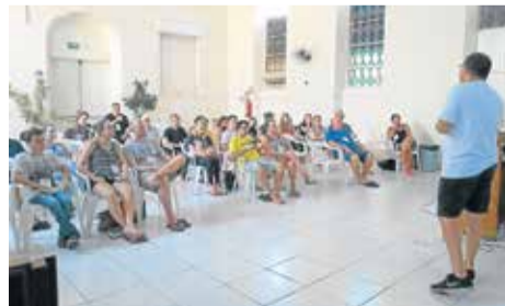
Foram oferecidos seis painéis

Também contribuíram para que o Encontrão 2019 fosse um tempo de aprendizado, reflexão e comunhão completos as apresentações do Ministério Drime (abertura), o Grupo Metanoia, da Comunidade da Scharlau (manhã de sábado), o Grupo Aleluia (sábado à tarde) e o Ministério IASIS, de Caxias do Sul, que dirigiu os momentos de louvor e adoração. Cada um, à sua maneira, deixou uma profunda mensagem de fé e esperança (Gislaine Darde Krüger).