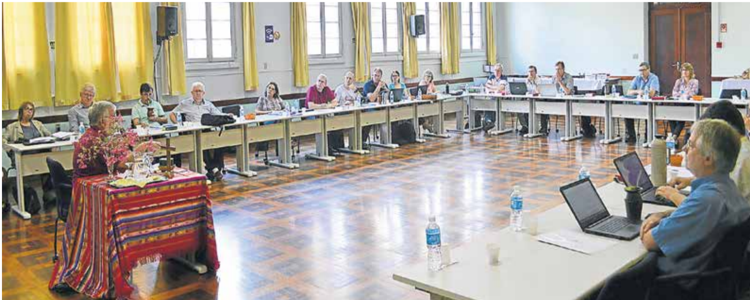
Comunicação Presidência IECLB

Pastores e Pastoras Sinodais dos 18 Sínodos da IECLB tiveram sua primeira reunião coordenada pela nova Presidência da Igreja (p.4)