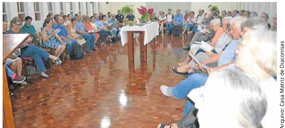
Arquivo: Casa Matriz de Diaconisas

Outro grupo de comunidades da IECLB que se organizou para a celebração do Dia Mundial de Oração foi o de São Leopoldo que, de forma ecumênica, reuniu-se com pessoas das comunidades das Igrejas Católica, Anglicana e Movimento dos Focolares. Cerca de 90 pessoas estiveram na Casa Matriz de Diaconisas, que hospedou o evento. A entidade, integrada ao Sínodo Rio dos Sinos, neste ano de 2019 completa seus 80 anos de atividades voltadas ao serviço diaconal e a pregação da palavra de Deus.